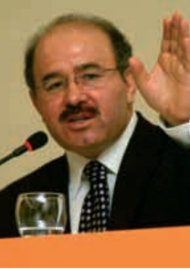
Milli Eğitim Bakanı Dr Hüseyin Çelik: "Biçimi ne olursa olsun, şiddete hiçbir şekilde tolerans gösterilmemelidir"