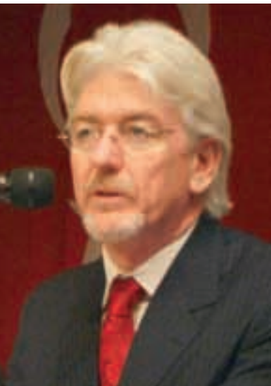
UNICEF Temsilcisi Edmond McLoughney: "Okulda şiddet küresel bir sorundur"