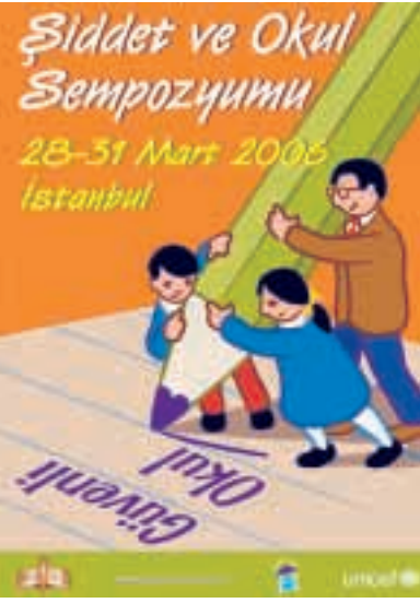
Türkiye'nin Birinci Okul ve Şiddet Uluslararası Sempozyumunun tanıtım posterini